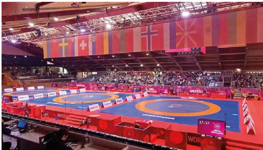
Organizátori premenili jazdeckú arénu na zápasnícku halu