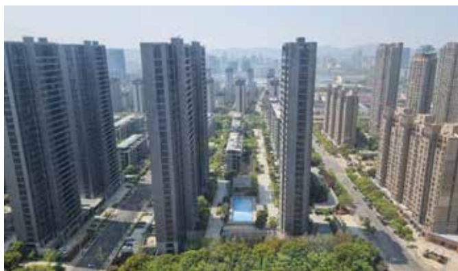
Osemmiliónové mesto Wuxi