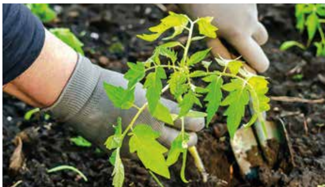
Priesady paradajok vysádzajme do záhrady radšej až koncom mája

Máj je ten pravý čas na použitie farebných lepových pascí.