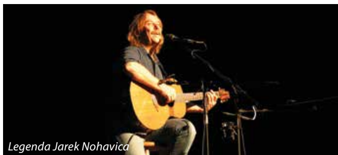
Legenda Jarek Nohavica