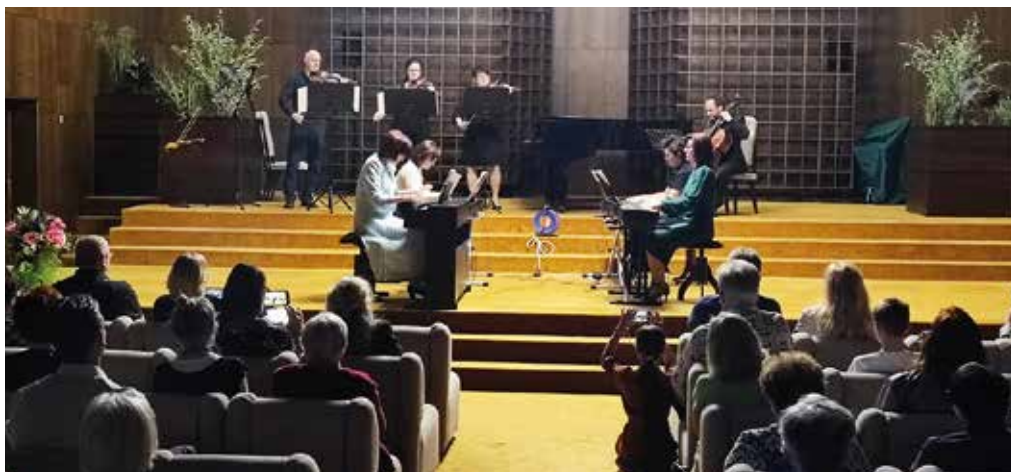
Počas večera zaznel aj koncert J. S. Bacha pre štyri čembalá a sláčiky