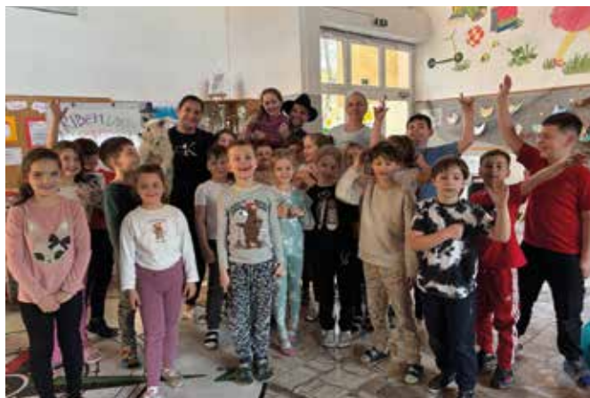
Podujatie Andersenova noc sa na ZŠ Mateja Bela konalo už druhýkrát

Podujatie odštartovalo výnimočné predstavenie „Divadlo