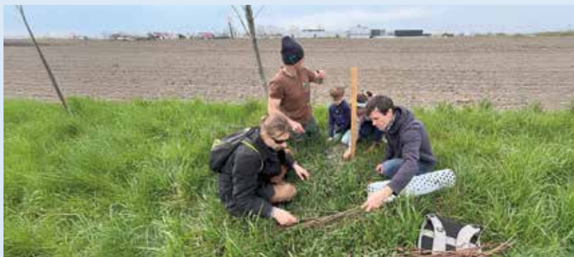
Dobrovoľníci zachraňujú starú hruškovú alej aj vrúbľovaním novovysadených stromov

Vetvy zo starých hrušiek nazbierané v januári navrúbľovali na podpníky vysadené na jeseň minulého roka. Cieľom združenia je obnoviť starú alej pri ceste do Bučuháze a zachovať genofond tejto starej sorty hrušiek pre budúce generácie. Odborným garantom aktivity bolo Záhradníctvo Abies z Čilistova. Nové stromčeky – podpníky boli minulý rok vysadené za podpory Nadácie Ekopolis.