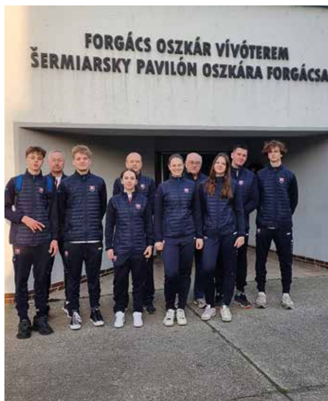
Šamorínsky tím pred cestou