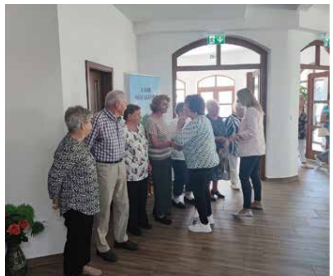
Na stretnutí blahoželali členom, ktorí zavŕšili 80 alebo viac rokov

Akcia pokračovala v poobedných hodinách olovrantom a po nej nasledovala zábava so živou hudbou do neskorých hodín. (I)