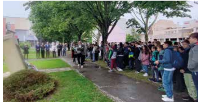
Na veľkého štátnika Štefánika spomínali žiaci a študenti, zástupcovia samosprávy a Matice slovenskej