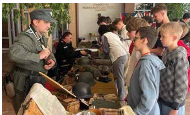
Deti si pozreli vojenskú techniku z obdobia druhej svetovej vojny