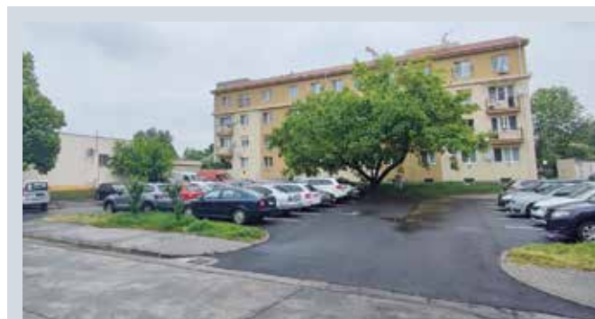
S príchodom jari sa v našom meste opäť rozbehli rekonštrukcie ciest a parkovísk. Koncom apríla a začiatkom mája bola ukončená oprava asfaltového povrchu časti Hlavnej ulice a dvoch parkovísk na Školskej ulici.