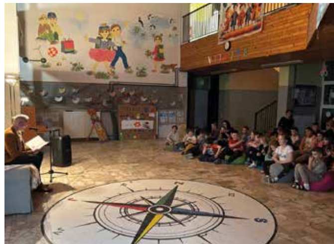
Deti si na akcii vypočuli rozprávky od známych slovenských hercov