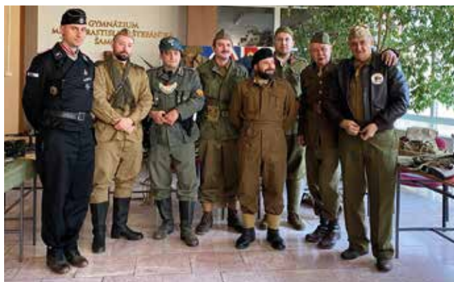
Organizátori predvedli autentické uniformy vojakov

Druhá svetová vojna začala napadnutím Poľska Nemeckom 1. septembra 1939 a skončila 8. mája 1945 bezpodmienečnou kapituláciou Nemecka. (pf)