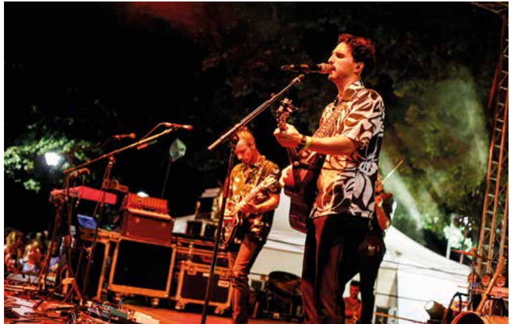
Feledhetetlen koncertet adott Somorján a Bagossy Brothers Company