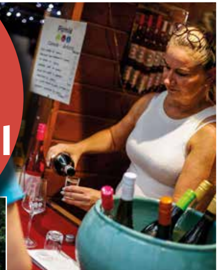
Idén is 23 borász hozta el borkülönlegességeit bemutatni Somorjára