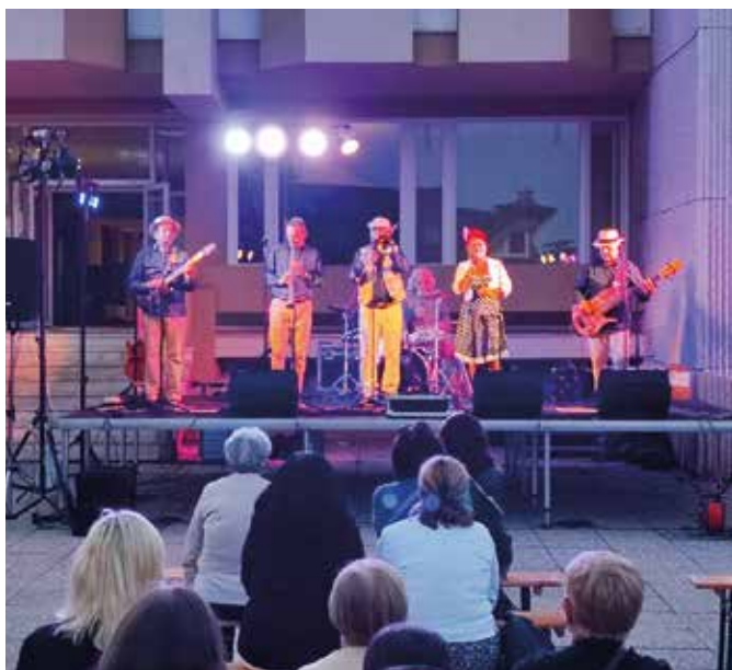
A rendezvényt sorozat a Golddies együttes koncertjével zárult

A hangversenysorozat idei évadát a Golddies Szwingatlánygyűnökség formáció koncertje zárta. A zenekar színvonalas muzsikájával, valamint a szwing és a hot jazz frappáns dalszövegeivel sikerült vidám, jókedvű bulival zárni a fesztivált. (s)