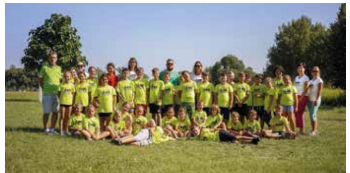
A kalandtábor résztvevői

A programot egy rövid gútori biciklitúra is színesítette, a résztvevők megtekintették a Szent Kereszt-templomot, és megis-