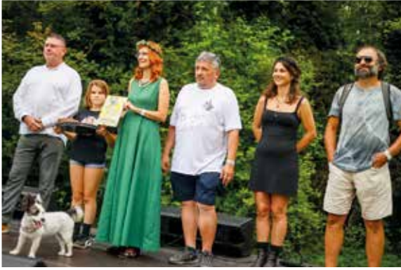
A fesztivál alkalmával mutatták be a Čarovný Šamorín című kötetet