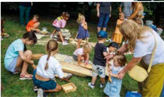
Meserét – ahol kicsik és nagyok egyaránt jól szórakoznak