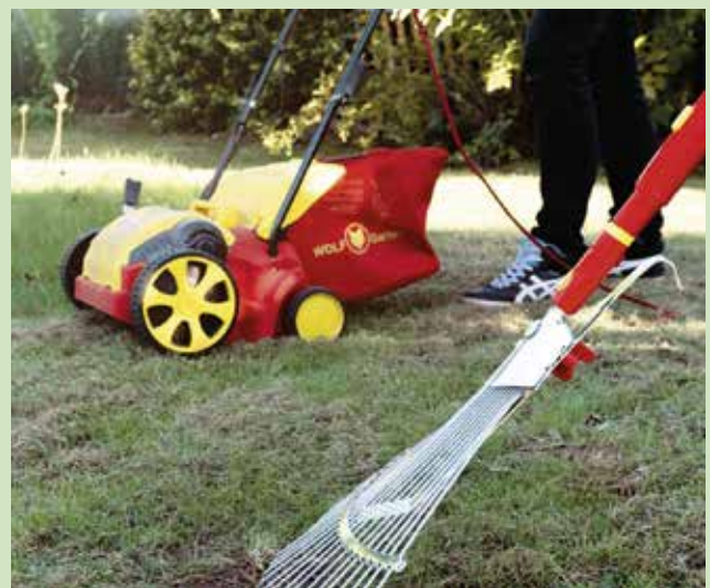
Ősszel szellőztessük át a gyept

Gyakori jelenség, hogy sárgásbarna, száraz körök jelennek meg a gyeptakarón, ami általában gombás eredetű fertőzés következménye. Hogy ezt orvosoljuk, első lépésben a száraz fűréteget gyökerestül távolítsuk el. Ezután a kopár foltokat és környéküket Askon vagy Magnicur Fungimat gombaölő szerrel permetezzük le. A