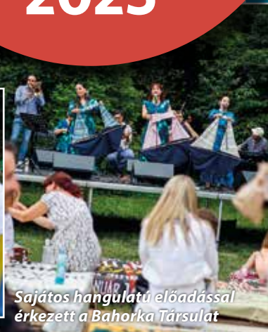
Sajátos hangulatú előadással érkezett a Bahorka Társulat