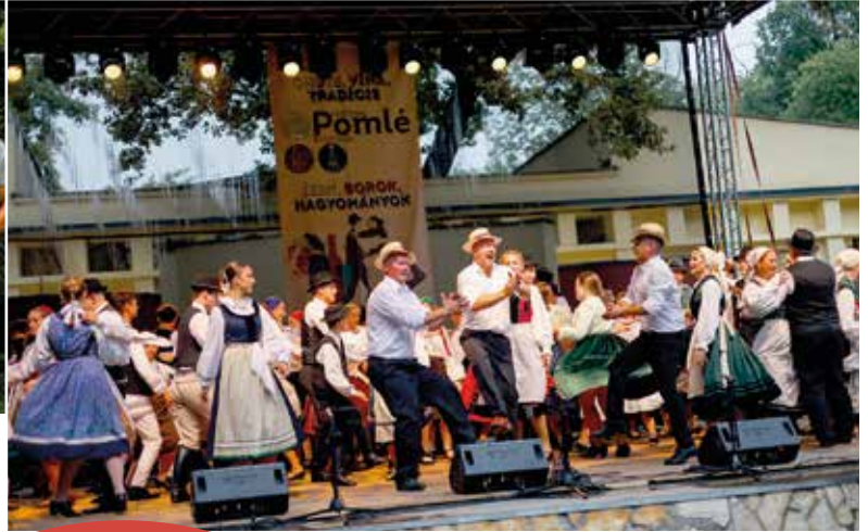
Gyermek és felnőtt néptánc-együttesek gálaműsorát láthatta szombaton a nagyközönség

A somorjai parkerdő adott otthont augusztus utolsó hétvégén a Felső-Csallóköz legnagyobb kulturális és borfesztiváljának, a Pomlé Fesztiválnak.