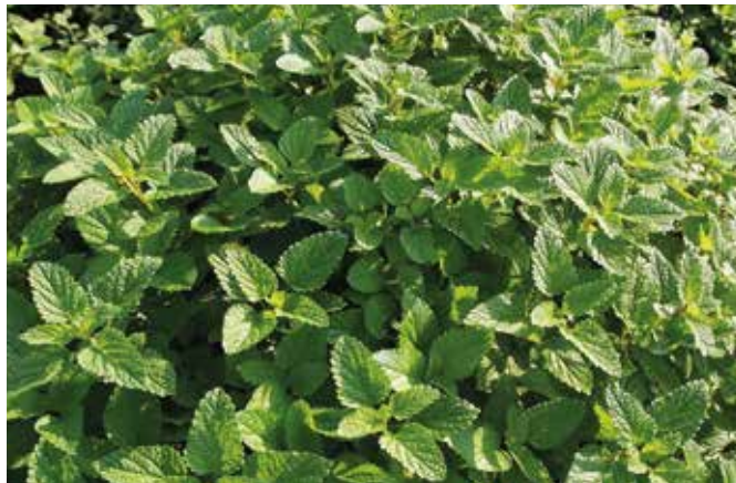
A citromfű egészségre gyakorolt jótékony hatása évezredek óta ismert

A nyár elteltével újra megjelenik az üzletek polcain a dughagyma és a fokhagyma. Ha a dughagymánál nagyobb méretű hagymákat használunk, és azokat – a tavaszi ültetéssel ellentétben – 5-6 cm mélyre ültetjük, ezzel elérjük, hogy hosszú, fehér szárat növesztessenek. Az őszi ültetésnél