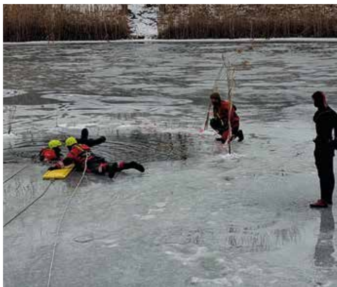
Dňa 17. januára sa konalo spoločné cvičenie dobrovoľných hasičských zborov zo Šamorína, Veľkej Paky a Mliečna. Hasiči si precvičili záchranu osôb zo zamrznutých vodných plôch, správne používanie osobných ochranných prostriedkov, bezpečný zásah a spoluprácu pri zásahu.