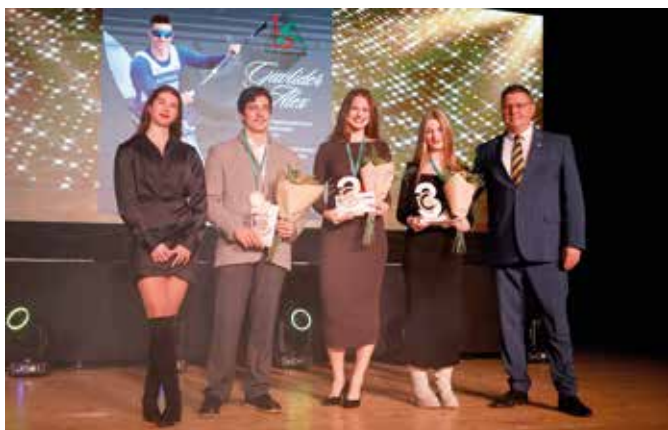
Najlepší šamorínski športovci do 20 rokov