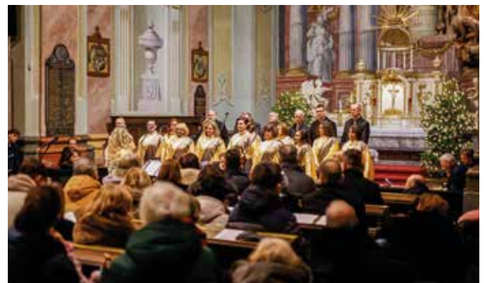
Koncert Chrámového zboru Sancta Maria bol krásnym a dôstojným uzavretím vianočného obdobia

Koncert sa uskutočnil s podporou Mesta Šamorín. (l)