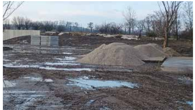
Hlavným cieľom modernizácie zberného dvora je zvýšenie miery zhodnocovania odpadov so zameraním na ich prípravu na opätovné použitie a recykláciu

S cieľom podporovať udržateľnú mobilitu môže mesto začať s budovaním infraštruktúry na nabíjanie elektromobilov už tento rok. Po ukončení kontrol z ministerstiev a procesov verejného obstarávania by sa na území Šamorína zriadilo dvanásť nových nabíjacích staníc: dve na jednosmerný prúd a dve na striedavý prúd s výkonom nad 50 kW by vznikli na Gútorskej ulici, ďalšie 4 nabíjacie stanice na striedavý prúd by boli vybudované na uliciach Gazdovský rad a Dunajská.