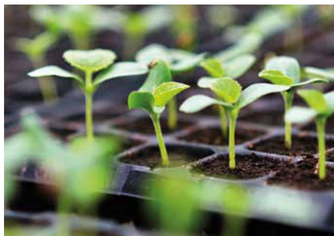
Začína sa obdobie pestovania priesad

Jednoduchý test klíčivosti si urobíme podľa tohto návodu: vezmeme si 20 semienok, položíme ich na vlhkú papierovú utierku a vložíme do plastového vrečka, aby nevyschli. Uchovajme ich v teple, pri teplote 20 - 25 stupňov Celzia. Životaschopné semená vyklíčia do 7 - 10 dní. Ak vyklíči 15 semienok, znamená to 70 - 80 % klíčivosť, takže ich môžeme bezpečne zasiať. Ak ich je však menej, neoplatí sa s tým zaoberať.