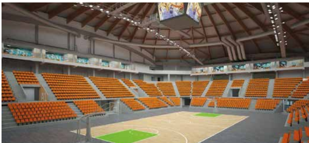
Takto by mohla vyzeráť nová šamorínska olympijská arena – bude svetového formátu

Zariadenie bude spĺňať tie najvyššie medzinárodné profesionálne štandardy, vďaka čomu bude vhodné na usporiadanie prestížnych svetových súťaží ako sú turnaje FIBA alebo ITF. Podľa plánov bude hala a tribúna s kapacitou 5 000 miest hostiť celkovo 15 olympijských športov. Obyvatelia v súvislosti s rozsiahlou výstavbou už skôr vyjadrili obavy zo zvýšenej nákladnej dopravy. Primátor Csaba Orosz na svojej stránke na sociálnych