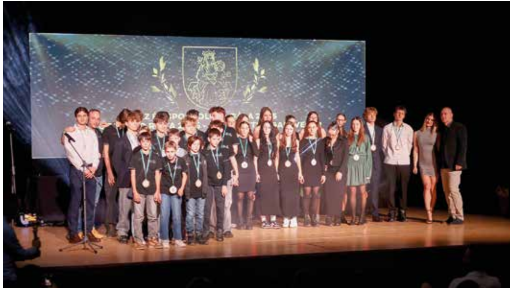
V súťaži družstiev uspeli florbalisti Snipers.