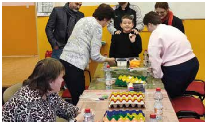
Prvé oficiálne klubové stretnutie

Dlhodobým plánom je zriadiť oficiálne denné centrum, stacionár, kde by bola postihnutým poskytovaná nepretržitá inštitucionálna podpora. Organizatori veria, že sa pri centre vytvorí stabilná podporná komunita. Považujú za dôležité zapojiť aj rodičov a príbuzných, pre ktorých plánujú stretnutia a prezentácie. (k)