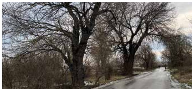
Podľa odborného odhadu majú staré moruše aspoň sto rokov