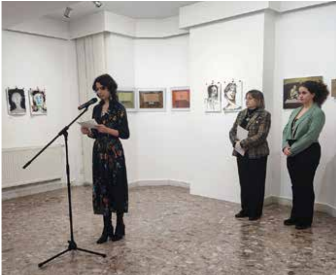
Mladá výtvarníčka privítala návštevníkov vernisáže