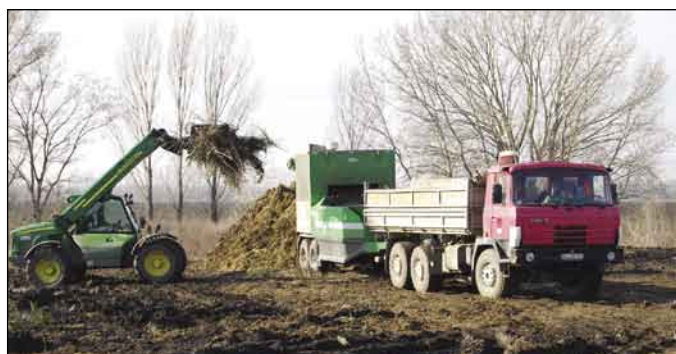
A somorjai hulladékgyűjtő udvaron január 29-én és 30-án a BIOPRODUKT Dunajský Klátov Kft. darálógépe ledarálta és elszállította a csaknem fél év alatt összegyűlt ághulladékot. Az anyagmennyiség elérte a 70 tonnát

– Mindenképpen fejlődésről beszélhetünk, hiszen sikerült a hulladékgyűjtő konténerek számát emelnünk a lakótelepeken, egyre jobban működik a somorjai gyűjtőtelep, ahol sikerült megoldani a kartonpapír és a táblaüveg gyűjtését. Megoldottuk a műanyag zsákok, -flakonok, elektronikai eszközök, akkumulátorok, gumifélék elkülönített gyűjtését. Nagy eredménynek számíthat, hogy a különválogatott beton, amelynek mennyisége több száz tonnára tehető évente, darálása és értékesítése is megoldott, ezáltal sem terheli a somorjai hulladékgazdálkodás költségvetését. Teljes mértékben megoldott a zöld-