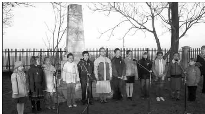
A tejfalusi alapiskola tanulói rendszeresen szerepelnek a március 15-i pipagúyjúti ünnepségen

A zöldövezet, a családi légkör, a gyermekközpontú pedagógiai szemlélet lehetővé teszi az ide járó tanulók személyiségének legteljesebb kibontakoztatását. Nagy előnye az iskolának, hogy a tanulók foglalkoztatása kisebb (10-15 fős) csoportokban tör-