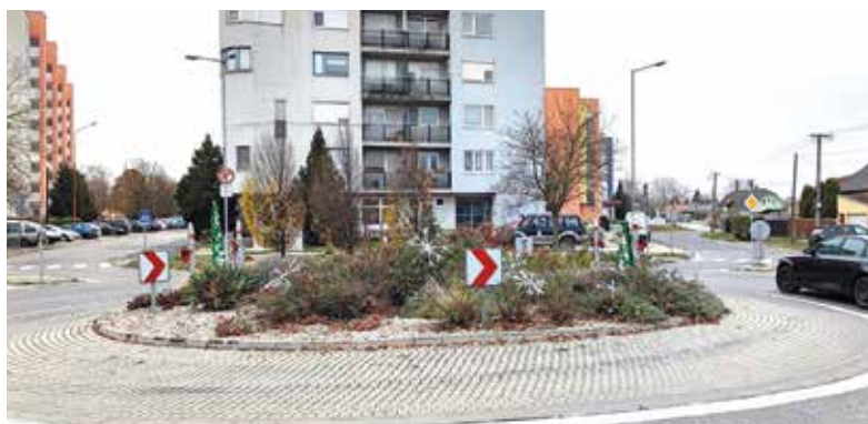
Gútori úti körforgalom – Corvin Mátyás Alapiskola