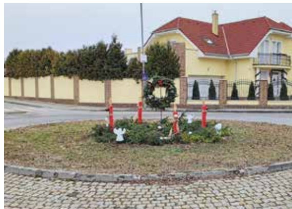
Mély úti körforgalom – Iskola utcai Óvoda