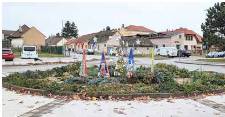
Csölösztoi úti körforgalom – Szél Utcai Óvoda