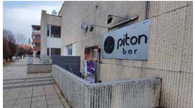
A környéken lakók többször is feljelentést tettek

A bár törzsvendégei nem a somorjai fiatalok voltak. Lehet, hogy néha odatévedt pár somorjai is, de a legtöbben messziről elkerülték. Szinte csak a környező települések lakosai, meg a külföldi vendégmunkások jártak oda, randalíroztak, a máshol megvett olcsó alkoholt a bár mellett, a parkolóban itták, hangoskodtak, emiatt rengeteg környéken lakó tett bejelentést, sőt petíciót is írtak. Volt, amikor átmenetileg javult a helyzet, de inkább csak a járvány miatt volt nyugalom egy rövid ideig.