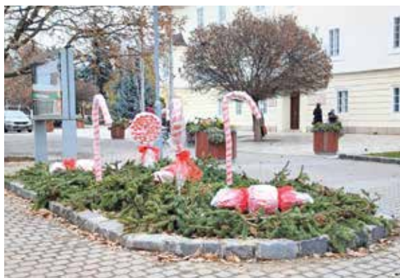
Fő utca, a városi hivatal előtt – Tejfalusi Óvoda