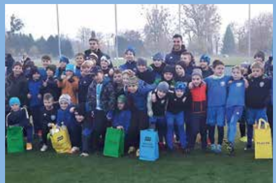
Egyre nagyobb hangsúlyt kap a környezettudatosságra nevelés az óvodákban és az iskolákban is

A futballklub egyébként elkezdte magát a környezetvédelem mellett. A focisták csatlakoztak a Föld napján szervezett rendezvényhez, többször is kitakarították a stadion és a Pömlé parkerdő környékét, a sportolók csatlakoztak az autómentes naphoz is, a stadionban és környékén szelektív hulladék gyűjtésére szolgáló kukákat helyeztek el.