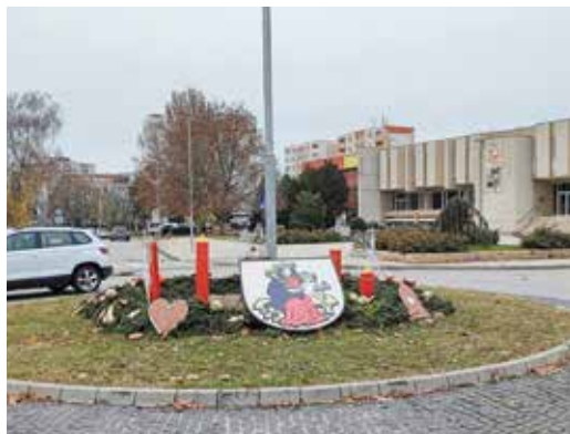
Szél utcai körforgalom – Bél Mátyás Alapiskola

Városunk óvodáinak és iskoláinak pedagógusai idén is gondoskodtak arról, hogy ünnepi díszben pompázzon a város központja és a forgalmasabb közlekedési csomópontok. Köszönjük valamennyiüknek. (1)