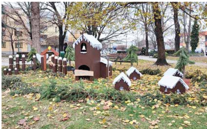
Fő tér – Kiskakas Bölcsőde és Óvoda