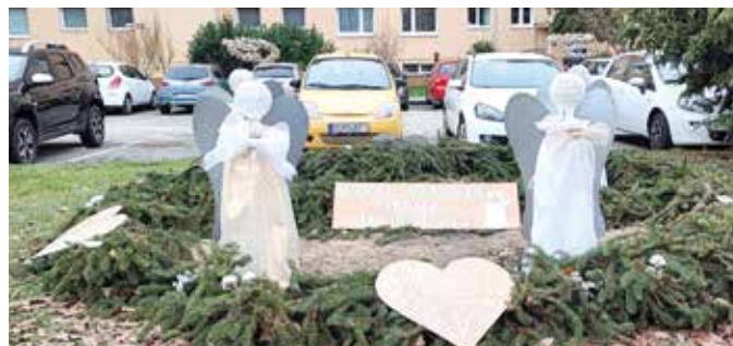
Fő utca, a városi hivattal szemben – Duna utcai Óvoda