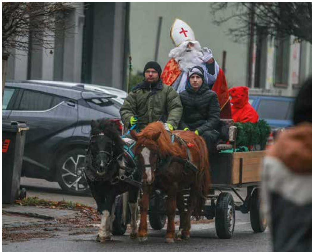
A Somorjai Önkéntes Tűzoltó Testületnek köszönhetően idén is ellátogatott városunkba a Mikulás, a kicsik és nagyok öröme. December 5-én lovas kocsin járta be a város utcáit, a somorjaiak az ablakokból, az erkélyekről köszöntötték. A Fő tere érvé fénybe borította a város karácsonyfáját; az eseményt a város Facebook-oldalán közvetítettük.

Míg az első hullám idején az eminensek között emlegették Szlovákiát, a járvány második, masszív támadásakor látványosan kicsúszott az irányítás az illetékesek keze közül. Sajnos a döntéshozók, de a lakosság sem tanult a hibákból, és úgy tűnik, a tavalyi mintát követve a kormány ismét csak akkor lép, amikor már késő. A tavalyi lesújtó eredményeket mindannyian ismerjük, idén december elején pedig már napi 10 ezer körül volt a fertőzöttek száma, és mostanáig összesen több mint 14 ezer áldozatot követelt a járvány. A mostani újabb hullám idején pedig már fegyverünk is van a betegség ellen, mégpedig az oltás, ám a lakosság több mint fele a mai napig nem kért belőle, annak ellenére, hogy november végéig a kórházi ápolásra szoruló betegek több mint nyolcvan százaléka az oltatlanok közül került ki. Hogy a halálesetek száma csökkenjen – és itt nemcsak a covid-19 áldozataira kell gondolni –, hogy elkerülhető legyen a kórházak túlterheltsége, ahhoz arra lenne szükség, hogy mindannyian betartsuk a járványügyi intézkedéseket, és mindenki értse meg, hogy egyedül az oltás védhet meg bennünket a legrosszabbtól. (s, k)