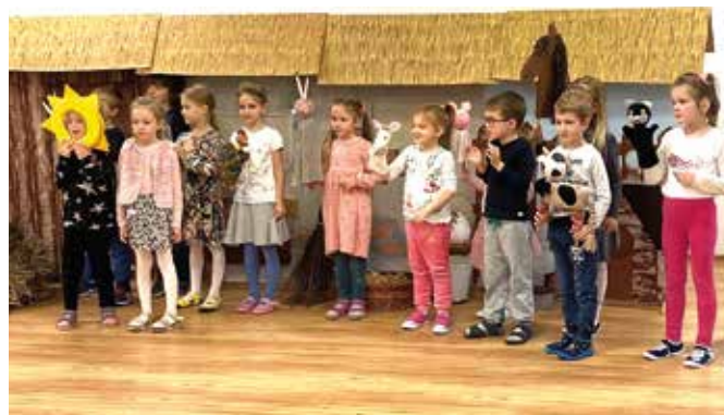
Az óvoda Piros csoportja elismerő oklevelet és 300 ezer forint értékű sportszer- és játéksomagot kap.