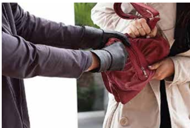
Pénztárca, telefon, bankkártya, kulcsok - minden a táskában volt

„A tettes általában kevésbé forgalmas helyen kémád. Kiszemeli az áldozatot, kivárja a megfelelő pillanatot, odahajjt, lerántja a válláról vagy kitépi a kezéből a táskát és elmenekül” - mondta Szabados Imre, a városi rendőrség parancsnoka. „Ilyen támadás például a Gazda soron és a buszmegálló melletti parkban is történt. A városi és az állami rendőrség