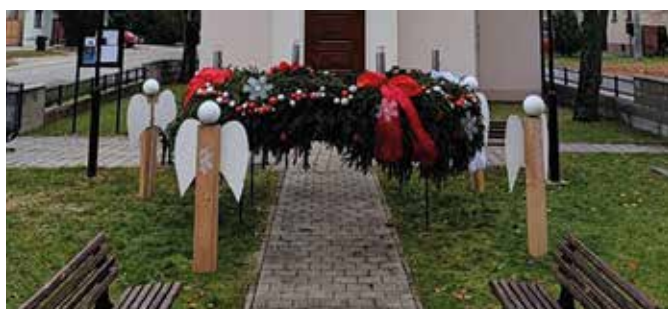
A tejfalusi kápolna előtti tér – Tejfalusi Alapiskola