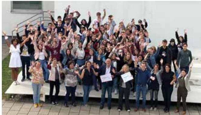
Nagyon jól érezték magukat a gimnazisták Ausztriában

Az együttműködés célja egyebek mellett a fenntartható fejlődés fontosságának hangsúlyozása, a Fair Trade mozgalom megismerése, az egyén ökológiai lábnyomának csökkentése. A Südwind Niederösterreich képviselői által vezetett foglalkozások során bővíthettük ismereteinket olyan témakörök-