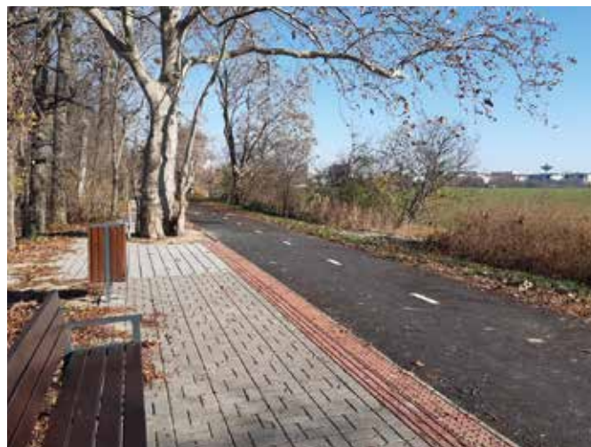
Sétányt is kialakítottak a kerékpárút mellett

A beruházás keretében elkészült még három pihenőhely, továbbá fedett kerékpártárolókat helyeztek el a Bél Mátyás Alapiskola mellett és az autóbusszállomáson. A Négyesek-Pomlé nyomvonalról felfestéssel jelölve leágazás lesz az autóbusszállomás és a Vicenza ipari park felé. A hivatalos átadást a jövő év elejére tervezik. „A beruházással nem csupán a Pomlét Csölösztővel összekötő kerékpárút épült meg, hanem a Négyesek szakaszán az X-bionics sportlétesítményhez és üdülőközpont-hoz, illetve a Dunához vezető