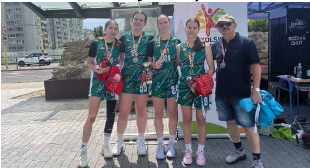
A Bél-Mátyás Alapiskola sikeres kosárlabdacsapata

A Bél Mátyás Alapiskola 3x3-as kosarasai sikerrel képviselték városunkat a rangos sporteseményen. Ők lettek a második legsikeresebb csapat Szlovákiában.