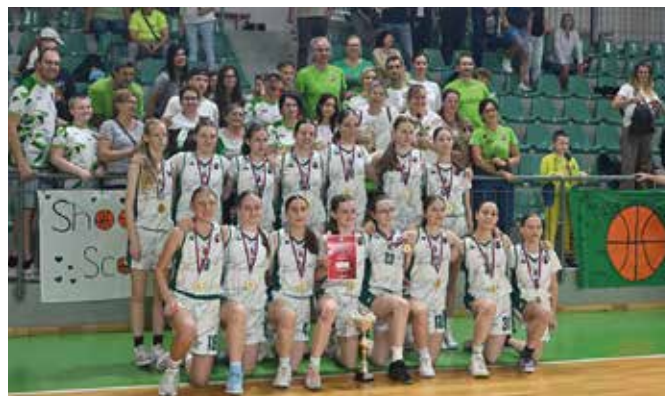
Az U14-es bajnokcsapat

„Van itt még egy nagyon fontos dolog. A már említett kategóriákban 15-20 játékos van. Ez nagyon jó jel a jövőre nézve is.