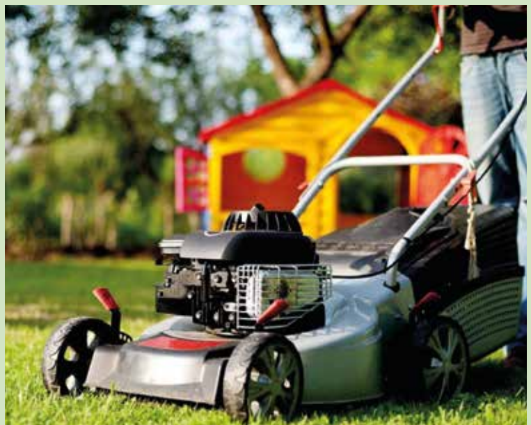
Nyáron ne vágjuk túl rövidre a pázsitot

Nyáron a pázsitot nagyon igénybe veszi az erős napsütés és a nagy hőség, ezért folyamatosan locsoljuk. Helyesebb ritkában öntözni nagyobb adag vízzel, mint fordítva. Locsolni reggel a legjobb. Ha a pázsitot este locsoljuk, az reggelig nedves marad, ami elősegíti a gombabetegségek kialakulását és terjedését. Ha sárga foltok jelennek meg a pázsiton, akkor valószínűleg gombás fertőzéssel állunk szemben. Ez ellen Askon vagy Magnicur Fungimat készítményt használhatunk. Ne feledkezzünk meg a pázsit műtrágyával való tápanyagpótlásáról, amelyet, miután szétszórjuk, jól be kell önteni. Augusztus második fele az egyik legalkalmasabb időszak a pázsit telepítésére. A nappalok már nem olyan melegek, az éjszakai hőmérséklet viszont nem alacsony. A fűszálak biztonságosan legyökereznek, és megerősödnek meg a tél beállta előtt. (1)