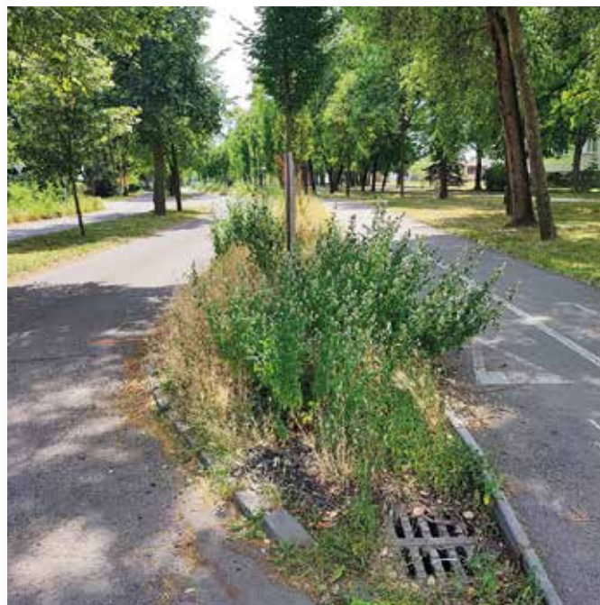
A méhlegelők a városok zöld oázisai

A méhlegelők kulcsfontosságúak a klímaváltozás hatásának enyhítése szempontjából is. Hozzájárulnak a városi hősziget-hatás csökkentéséhez, és elősegítik az esővíz természetes elnyelését. Az ilyen zöld oázisok kialakításával hozzájárulhatunk egy élhetőbb, egészségesebb városi környezet kialakításához. (l)