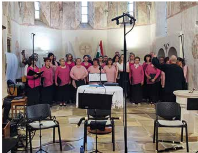
Emlékező hangversenyek adott otthon a református templom (Képarhívum)

Az ünnepség a templomkertben tartott családi agapével zárult. (s)