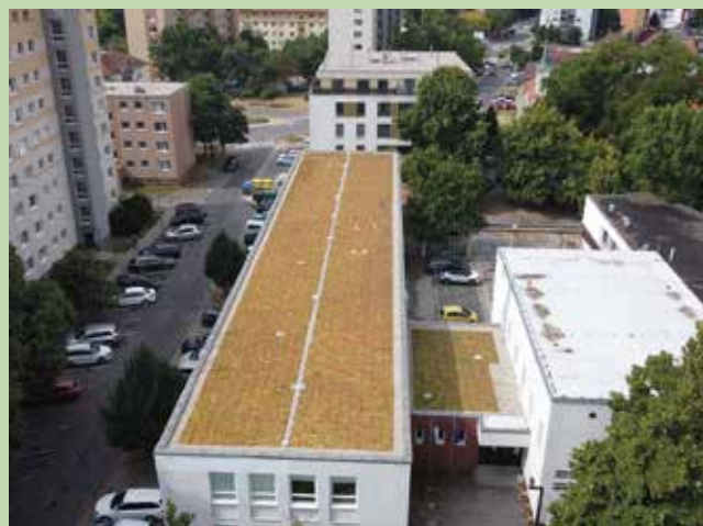
A kizöldült tetőzet, madártávlatból

A projektre Somorja az Interreg Magyarország-Szlovákia határon átnyúló együttműködési programból nyert el 184 862,91 eurós támogatást. A város ehhez további 123 828,10 euró önrészt biztosított. A projektben Somorja mellett Pozsony, Mosonmagyaróvár, Győr és Dunaszerdahely is részt vett, ahol főként belvárosi terek és parkok újultak meg. (1)