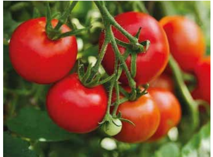
Fontos a paradicsom metszése, kacsozása

A paprikán ebben az évben is gyakran jelennek meg barna foltok. Ezt a kalciumhiány okozhatja, ami megszüntethető kalcium tartalmú folyékony műtrágya, például a Kalcidol