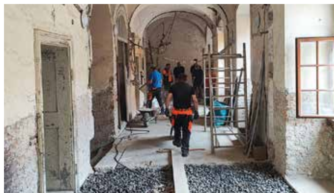
A beltérben folynak a munkálatok

nelmi témájú szabadulószozobákat alakítanak ki. A győri bencés kolostor régóta kihasználatlanul álló padlásán ugyanakkor interaktív kiállítóteret alakítottak ki, ahol a harangok történetével és működésével, a bencés nevelés múltjával és jelenével, valamint a barokk liturgia elemeivel ismerkedhetnek meg az érdeklődők. Közös konferenciát, megnyitót és ünnepséget is szerveznek a partnerek, workshopokat szerveznek középiskolások számára. A diákok a kialakításban is közreműködnek, segítettek megtervezni a somorjai szabadulószozobát, rövidfilmet és videót készítenek, amelyeket a győri