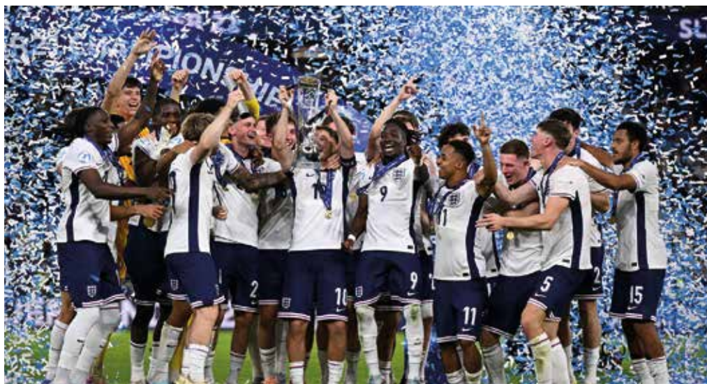
Anglia lett az U21-es Európa-Bajnokság győztese

Köztudott, hogy a 2025-ös U21-es Európa-bajnokság