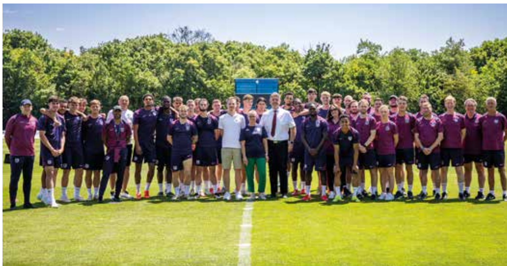
Az angol nemzeti csapat a Pomlében