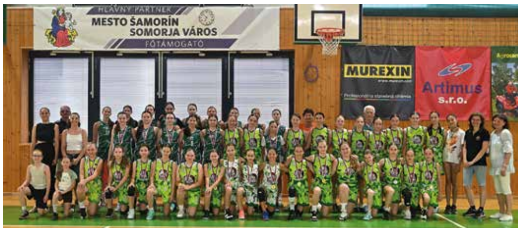
A Somorjai Kosárlabdaklub nagy családja

Hogy nagyon jó időnye lesz a klubnak, azt már bizonyították az alapszakasz eredményei, ahol több kategória sem talált legyőzőre. „Ezt bizonyítottuk a döntő tornákon is. Az U11-esek