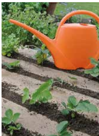
Augusztusban telepíthető az eper (Képarcívum)

A csonthéjas gyümölcsöknél (cseresznye, meggy és kajsz) a szüret után, július végéig