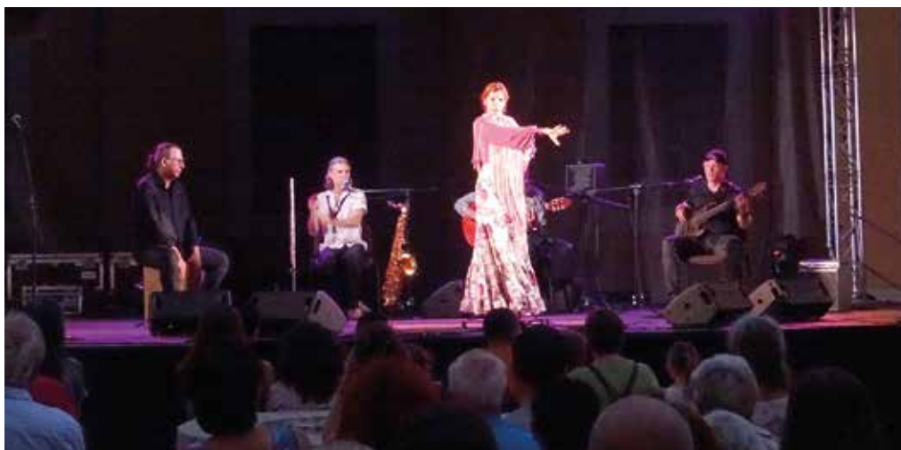
Tüzes andalúz dallamokkal érkezett a Ponte Pardo