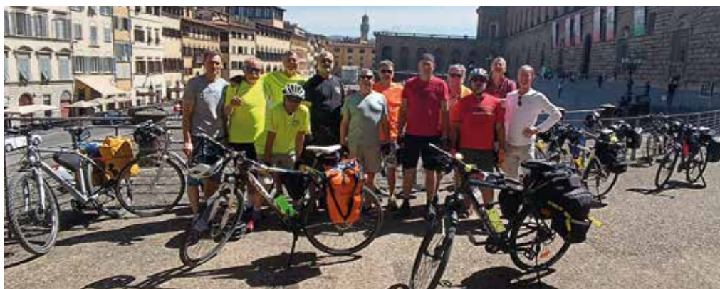
A firenzei Pitti palotánál

Az autós visszaút az éppen esős Ausztrián keresztül lassú volt, az egy hét alatt lekerekedett közel 600 km megtétele után június első napján fáradtan, de nagy örömmel érkeztünk haza. (jt)