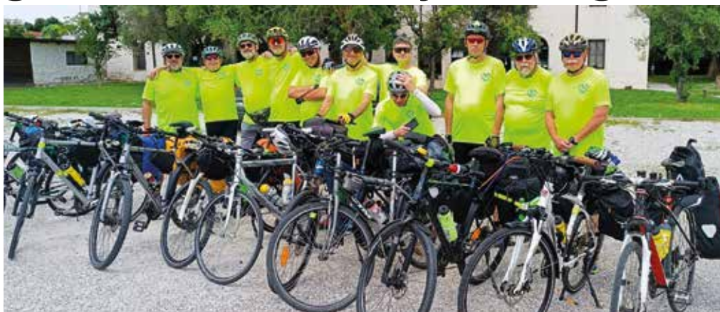
Gyülekezés a startvonalon

Az odaút a hajnali indulással sima volt, így már kora délután felpakolva kerekedtünk az aznapi célpont, Rovigo kisvárosába, ahol a központban éppen egy helyi fesztivál buli-hangulata fogadott bennünket. Olaszországnak ez a része sík vidék, teli kis folyókkal, kanálisokkal, mezőgazdasági településekkel, udvarházakkal. Sok történelmi hely, kastély kínál látnivalót. A második nap első pihenőjét már a ferrarai d'Este várkastély melletti sörözőben tartottuk. Estére Bolognába értünk, ahol a pompás városközpont, a középkori, karcsú, majdnem 100 méter