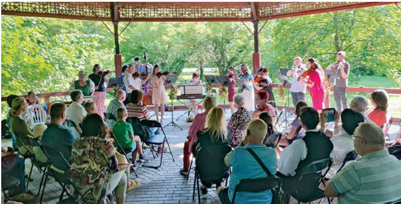
A tánckörbe visszatért a régmúlt idők hangulata

INGYENES KÖZÉLETI LAP 2025. JÚLIUS-AUGUSZTUS