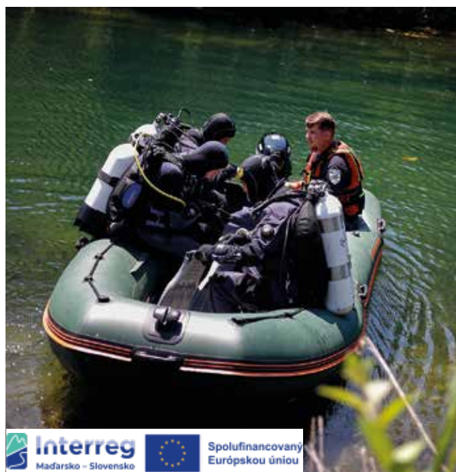
Akcióban a tűzoltók

A gyakorlat célja az volt, hogy a tűzoltók felkészüljenek a természeti katasztrófák, az időjárás okozta nehézségek vagy az árvizek okozta vészhelyzetek kezelésére. A szakmai gyakorlat szervezői megteremtették a lehetőséget a résztvevők számára, hogy fejlessék készségeiket, emellett erősítsék a nemzetközi együttműködést is, hogy a szervezetek közösen, hatékonyabban reagálhassanak a vészhelyzetekre. A rendezvényen bemutatták és kipróbálták a támogatásoknak köszönhetően beszerzett új felszerelést is. (1)