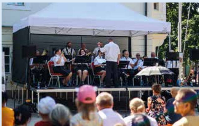
Színpadon a SÖTT tűzoltózenekara