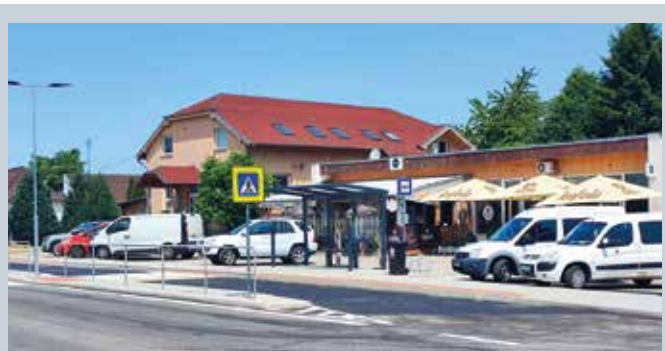
Biztonságosabb, szebb lett az új megálló

nak köszönhetően kényelmesebb lett a közlekedés. Idén már több, a közlekedési infrastruktúra modernizálását célzó beruházás valósult meg a városban, áprilisban és májusban például újraaszfaltozták a Fő utca egykori rendelőintézet előtti szakaszát, és felújítottak két parkolót az Iskola utcában, a Derby térségében. (l)