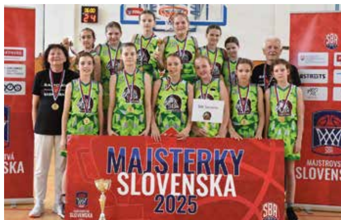
Az U12-es bajnokcsapat