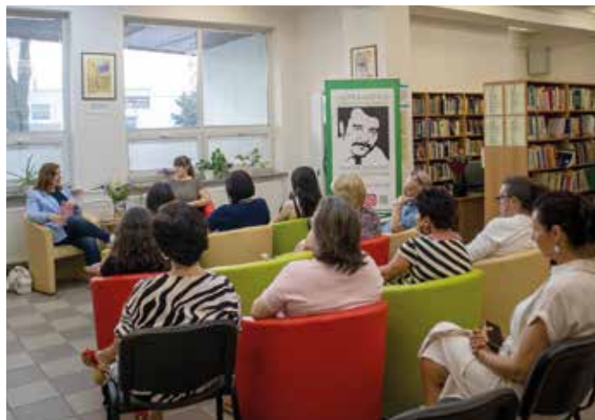
Ismét megtelt irodalombarátokkal a könyvtár olvasóterme