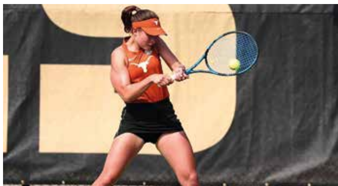
Sokat fejlődött a teniszben