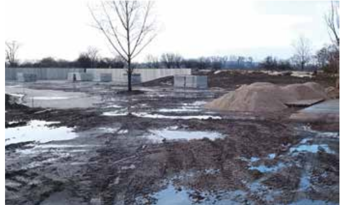
Európai forrásból bővíti a gyűjtőudvar kapacitását az önkormányzat

A fenntartható mobilitás jegyében a város idén megkezdheti az elektromos autók töltését szolgáló infrastruktúra kiépítését. A minisztériumi ellenőrzések és a közbeszerzési folyamatok lezárultát követően tizenkét új töltőpont létesülne a városban: a Gútori úton két darab, 50 kW feletti teljesítményű DC és két AC töltőpont, a Gazdasoron és a Duna utcában pedig további 4-4 AC töltőpontot hoznának létre.