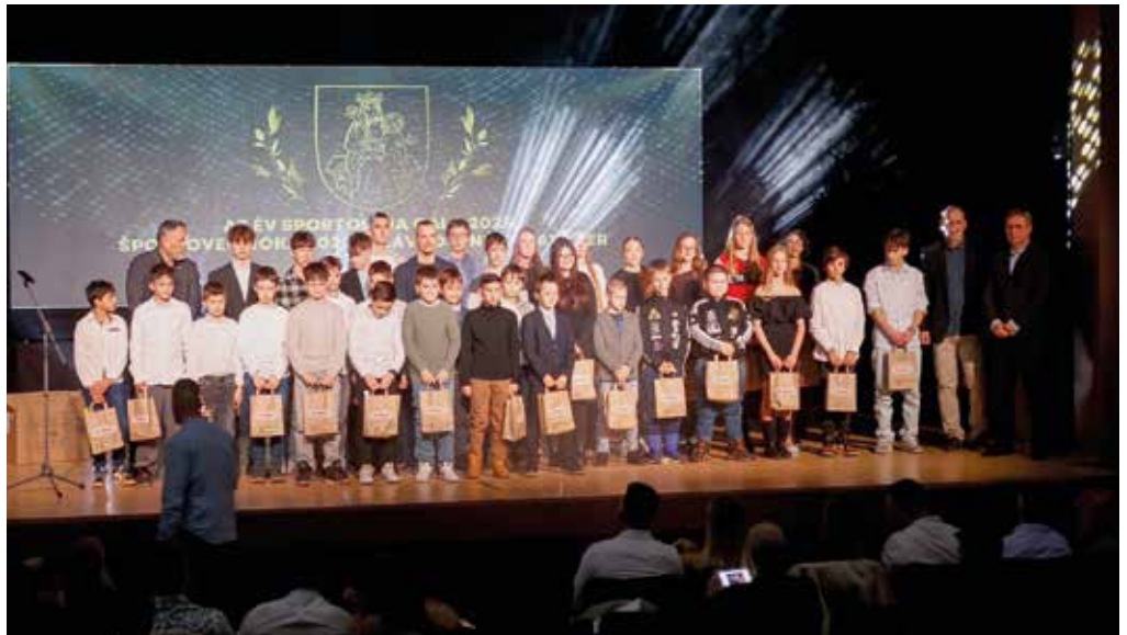
Sportolók, akik egész éves munkájukkal, elhivatottságukkal kiérdemelték az elismerést.