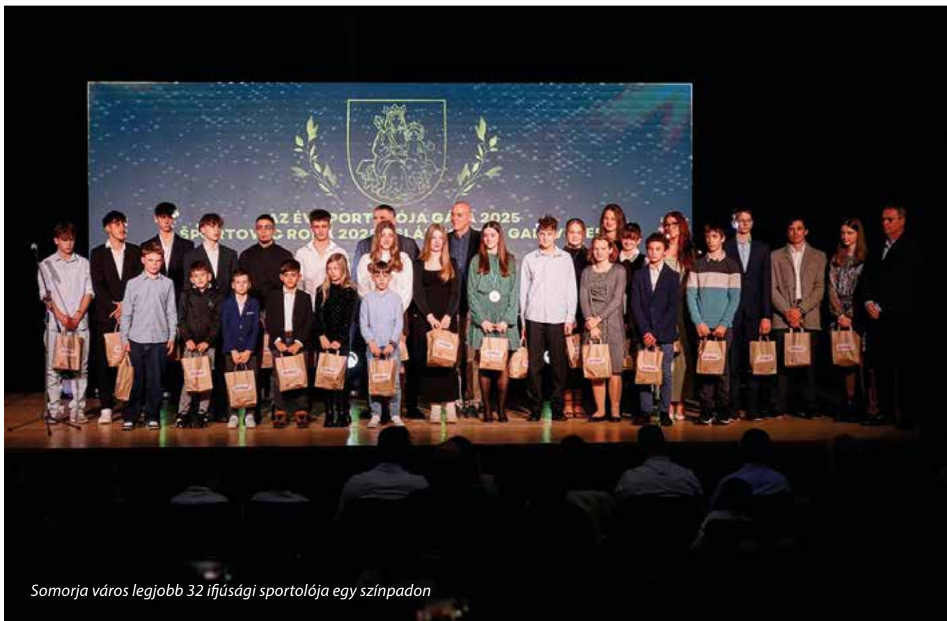
Somorja város legjobb 32 ifjúsági sportolója egy színpadon