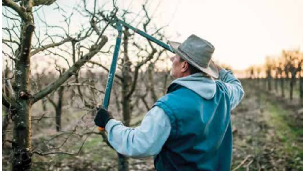
Az almafák metszése meghatározza a fa egészségét, a terméshozamot és a gyümölcs minőségét

Február elejétől, ahogy egy kicsit enyhül az idő, a gyümölcsfák nyugalmi állapota véget ér. Beindul a gyökértevékenység, megnövekszik a növények víztartalma, megduzzadnak a rügyek. Ez viszonylag kritikus időszak, ugyanis egy felmelegedés utáni fagyhullám nagy károkat okozhat, ahogy ez tavaly is történt. A fagykár elleni passzív védekezés a hidegtűrő, illetve későbbi fajták termesztése, a magasabb korona kialakítása, a törzs meszelése. Ennek lényege, hogy a fehér felület alatt a fa szövetei lassabban melegednek át, amivel meghosszabbítható a nyugalmi