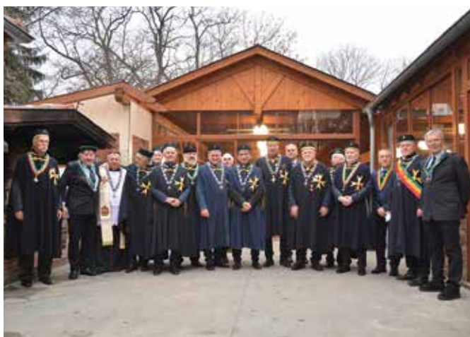
A borlovagrend tagjai évről évre összegyűlnek a Bartal Családi Pincészetben