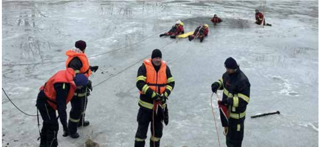
Közös gyakorlatot tartottak január 17-én a somorjai, a nagypakai és a tejfalusi önkéntes tűzoltók. A befagyott vízfelületekről való mentést, a védőfelszerelések helyes használatát, és a biztonságos beavatkozást gyakorolták.

A város önkéntes tűzoltóságának a jogszabályoknak megfe-