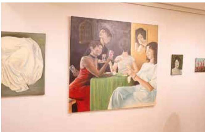
Változatos technikák, formátumok jellemezték a tárlatot