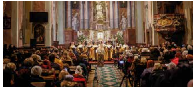
A közönségnek feledhetetlen élményben volt része

A koncert az önkormányzat támogatásával valósult meg. (l)