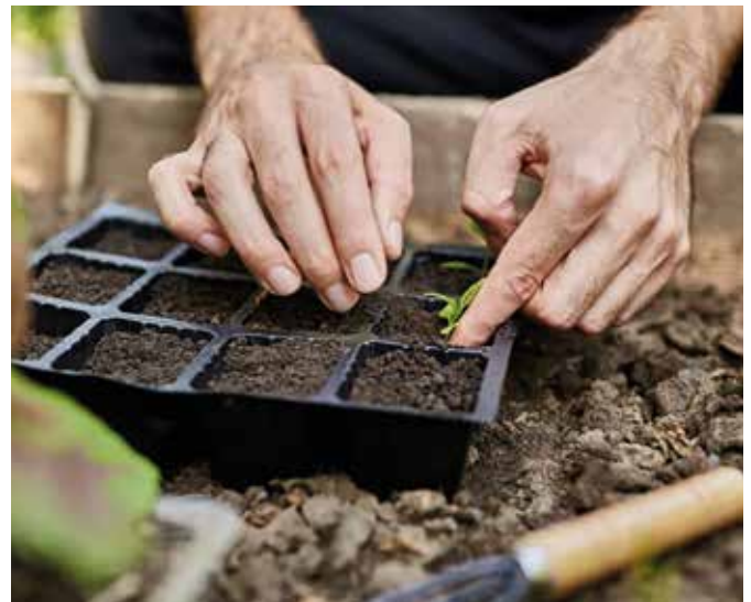
A sikeres palántanevelés alapja a megfelelő palántaföld és a jó minőségű magvak

Egyszerű csíráztatási próba: Vegyünk 20 magot. Helyezzük őket nedves papírtöröltre. Tegyük bele nejlonzacskóba, hogy ne száradjon ki. Tartsuk melegen, 20–25 fok közötti hőmérsékleten. Az életképes magok 7–10 napon belül kicsíráznak. Ha 15 mag kicsírázik, az 70–80%-os csírázóképeséget jelent, vagyis bátran kivethetjük. Ha azonban ennél kevesebb, akkor nem érdemes bajlódni vele.