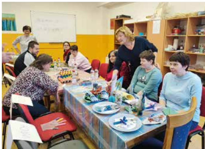
Az első hivatalos klubfoglalkozás

A hosszú távú terv egy hivatalosan működő nappali ellátóközpont létrehozása, ahol intézményes keretek között nyújtanának folyamatos támogatást az érintetteknek. A szervezők szeretnék, ha egy stabil közösség alakulna ki, és elmondták, hogy a szülők, a hozzátartozók bevonását is fontosnak tartják, találkozókat, előadásokat terveznek számukra. (k)