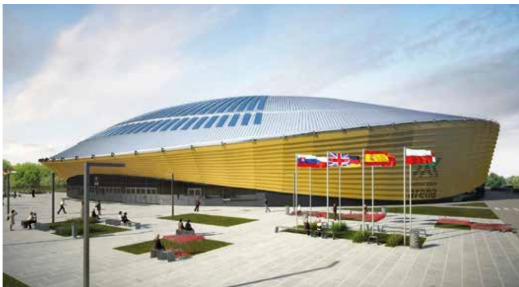
Az olimpiai központ látványterve