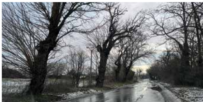
Sok telet megéltek az Ötösöki út szederfái

Érdekes lenne, ha ezek az emlékek – fényképek, történetek – megmaradnának az utókornak, ezért a szervezők arra kérik az olvasókat, ha régi fénykép, írásos anyag van a birtokukban, vagy olyan régi családi történetet őriznek, amely ezekhez a fákhöz köthető, osszák meg a Somorja és Vidéke szerkesztőségével, vagy hívják a 0905 145 920-as, illetve a 0948 032 506-os telefonszámot. (v)