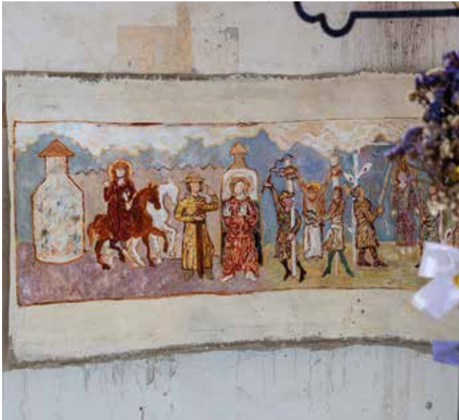
Výstave Beáty Méry dal domov románsky kostol v Šámote