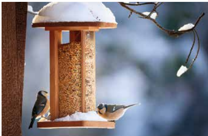
Aj zimné prikrmovanie vtákov má svoje pravidlá. Patrí k nim aj hygiena krmidla

Staráť sa o zvieratá je ušľachtilý čin, ktorý im v tomto období významne zvýši šance na prežitie. Obdobie prikrmovania trvá od prvých mrazov až do konca marca.