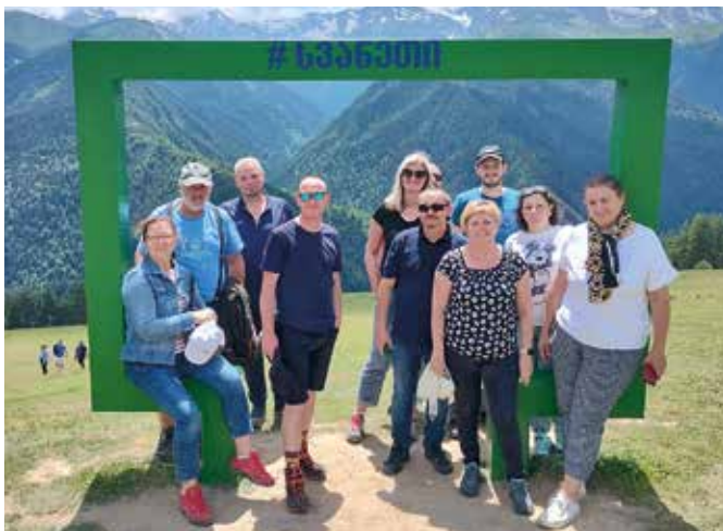
Kaukaz – raj na zemi

Nie, ja som skôr fanúšik Európy, aj keď by som asi bol ochotný prekročiť hranice starého kontinentu, aby som zažil napríklad Izrael alebo Maroko. Láka ma aj Južná Amerika, napríklad Patagónia, ktorú som spoznal ako dieťa z románov Julesa Verneho. Tento rok však beriem dve skupiny do Sedmohradska, navštívime mestá ako Nagyszalonta a Nagyvárad, budeme mať ochutnávku vína v obci Bihardiószeg a ďalšie atraktívne programy. Hotelbusom si znova pocestujem až v lete 2027, destináciou bude Sardínia a Korzika. Moji známi tam už boli a ukazovali mi neuveriteľné fotky, tak som sa rozhodol, že to musím vidieť na vlastné oči. Na mojich cestách si samozrejme vždy pozriem tie povinné pamätihodnosti, súčasne však vedome vyhľadávam aj miesta, ktoré nie sú o masovej turistike a kde je možné duchovno daného miesta precítiť. Neverím v rýchly spôsob života, mňa skôr láka klud, krásna pozorovania a komunitný život. To sú veci, ktoré vyhľadávam aj na mojich cestách. (I)