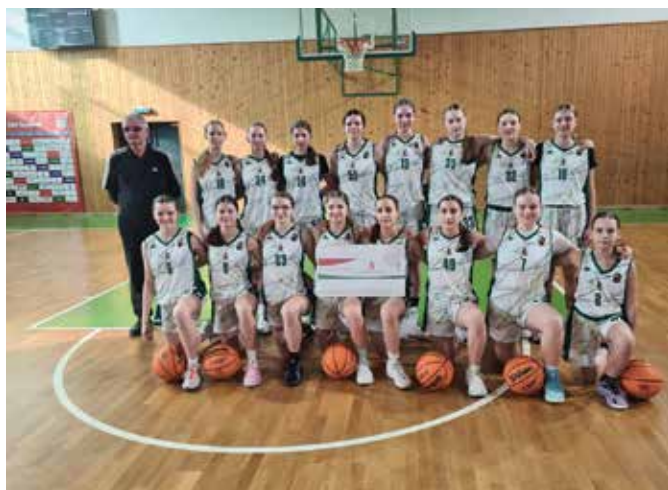
Majstrovské družstvo ŠBK Šamorín U14