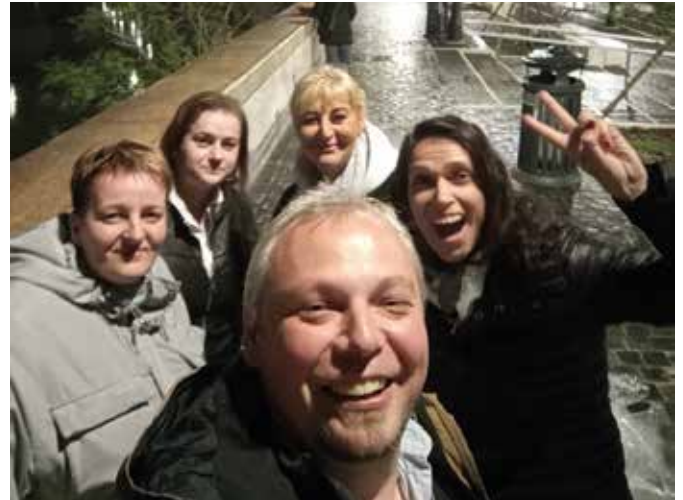
Večné mesto s večným tímom

To by som ani nepovedal, lebo ja mám napríklad jazerá oveľa radšej ako moria, ale vtedy som sa rozhodol, že musím Európu do detailov preskúmať. Mojou