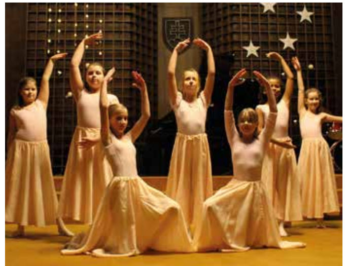
Koncertnú sálu ZUŠ naplnili melódie vianočných piesní a koledí, nechýbalo ani tanečné predstavenie

hudobníkov, ktorí svojím vystúpením navodili pocit pokoja a radosti z blížiacich sa sviatkov. Počas adventu usporiadala šamorínska zuška aj štyri koncerty pre deti materských škôl a žiakov základných škôl a má za sebou aj vystúpenia v Domove seniorov Ambrózia v Šamoríne a v Agape senior parku v Hornom Bare. (zus)