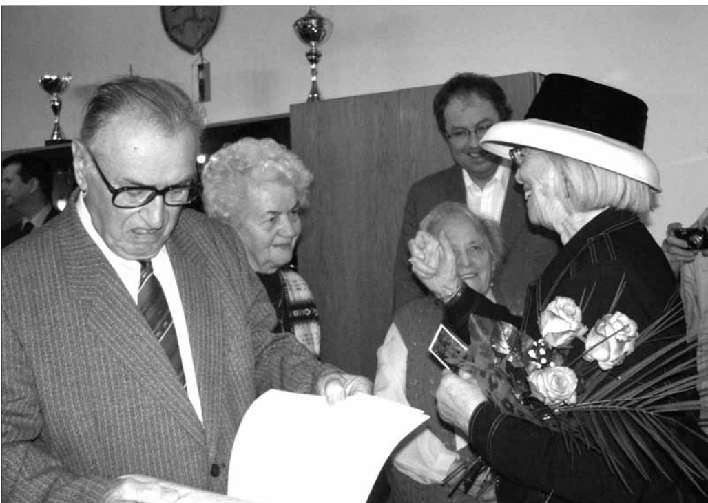
Stretnutie bývalých spolužiačok